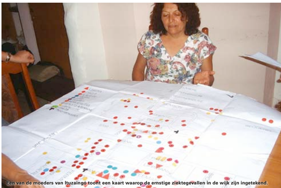
Een van de moeders van Ituzaingó toont een kaart waarop de ernstige ziektegevallen in de wijk zijn ingetekend.

Seeds of Deception , goed boek over genetische manipulatie: www.seedsofdeception.com