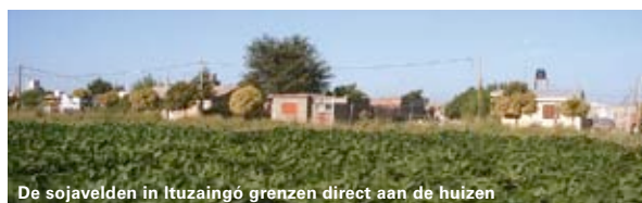
De sojavelde in Ituzaingó grenzen direct aan de huizen

een rechter in Santa Fe, Argentinië, middenin een enorm sojagebied. De gezondheid is belangrijker dan de soja, zo luidde de conclusie. De gentech-soja waar het hier om gaat groeit op grond die niet recent is ontbost en voldoet wat dat betreft aan de criteria voor 'verantwoorde' soja. Met de huidige beperkte criteria is de kans groot dat deze soja straks het label 'verantwoord' krijgt.